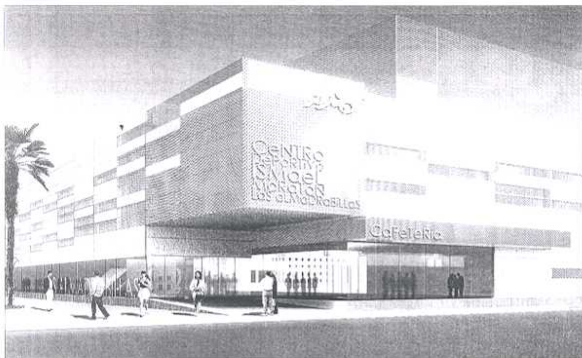
Este será el nuevo aspecto de la céntrica fachada del complejo polideportivo, situado junto a la Avenida Cabo de Gata. JUA VIG