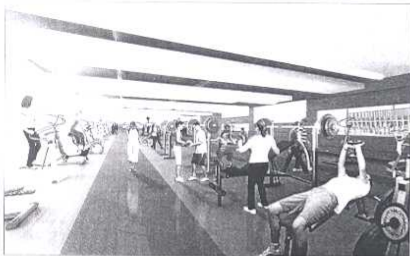
■ Imagen de una de las diferentes salas deportivas con las que contará el centro.