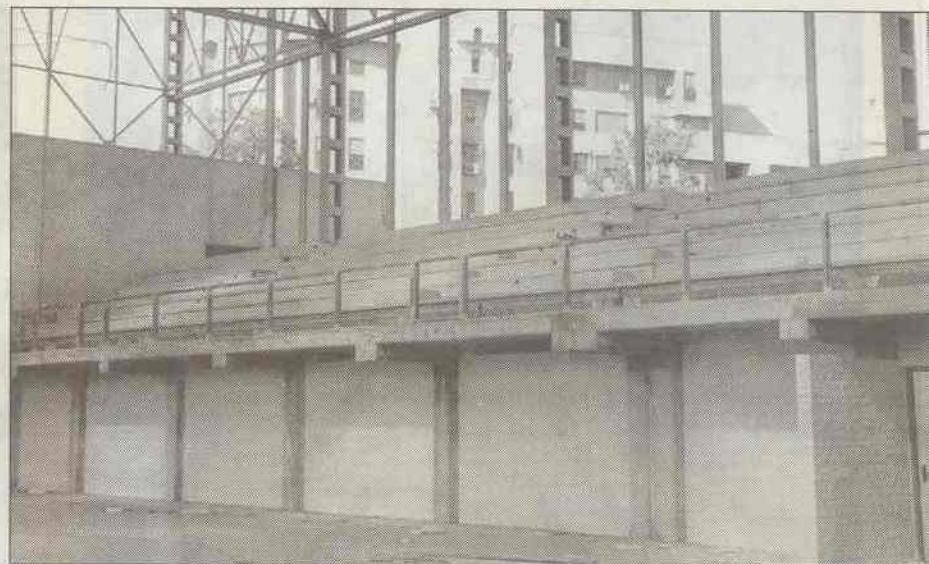
En estas imágenes, distintos momentos del proceso de construcción de la estructura y grada interior del Centro de Tecnificación Deportiva.