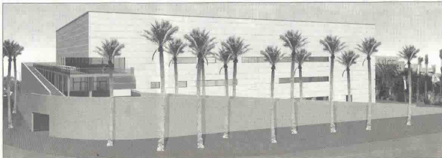
Imagen virtual del Centro de Tecnificación Deportiva de la Diputación Provincial de Almería.