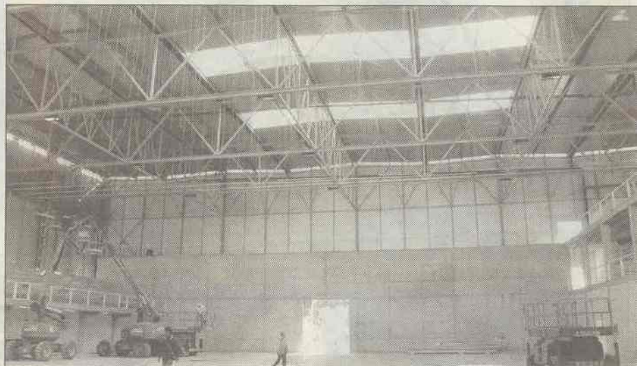
El Centro de Tecnificación Deportiva es una superficie de 6.600 metros cuadrados. El volumen central del edificio tiene una base rectangular, ejecutado a base de losa tipo sandwich.