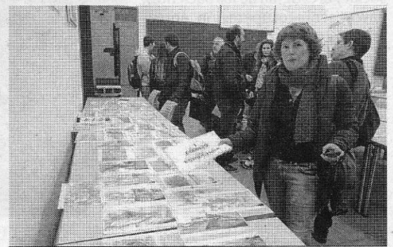
Aula que acogía los trabajos del taller.