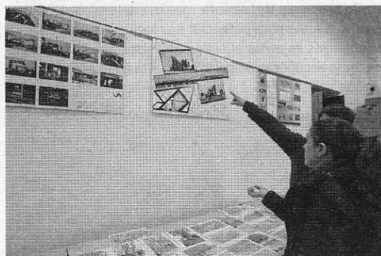
Algunos de los ejemplos del taller de Sol Úbeda.